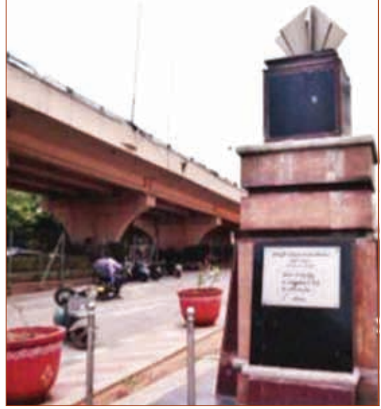
హైదరాబాద్ లోని బషీర్ బాగ్ లో విద్యుత్ అమరవీరుల స్మారకస్థూపం