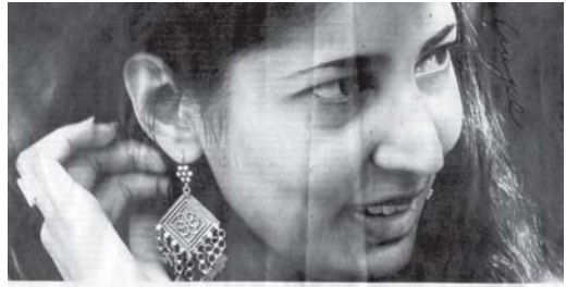
The showbiz called writing